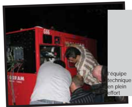
L'équipe technique en plein effort

Au théâtre, il y a des comédiens, des costumes, des lumières et des sons, et, devant (d'accord, parfois c'est derrière ou au milieu, mais bon, on se comprend), il y a le public. Jusque-là, on savait.