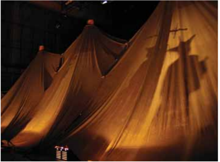
^La Tétralogie de Quat'Sous La Tétralogie de Quat'Sous >