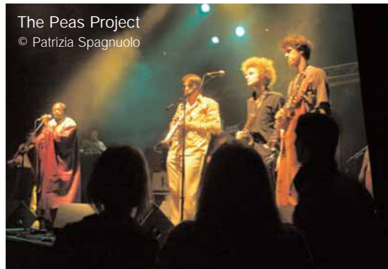
The Peas Project