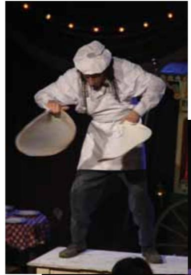
La Cucina dell'Arte