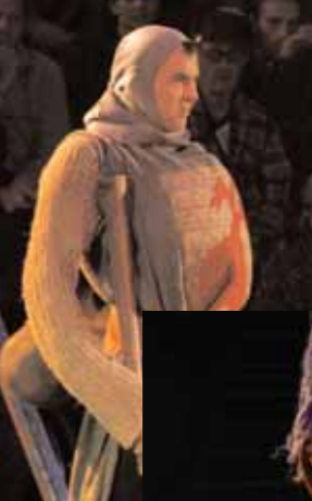
Les Vieux Démons