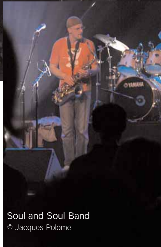
Soul and Soul Band