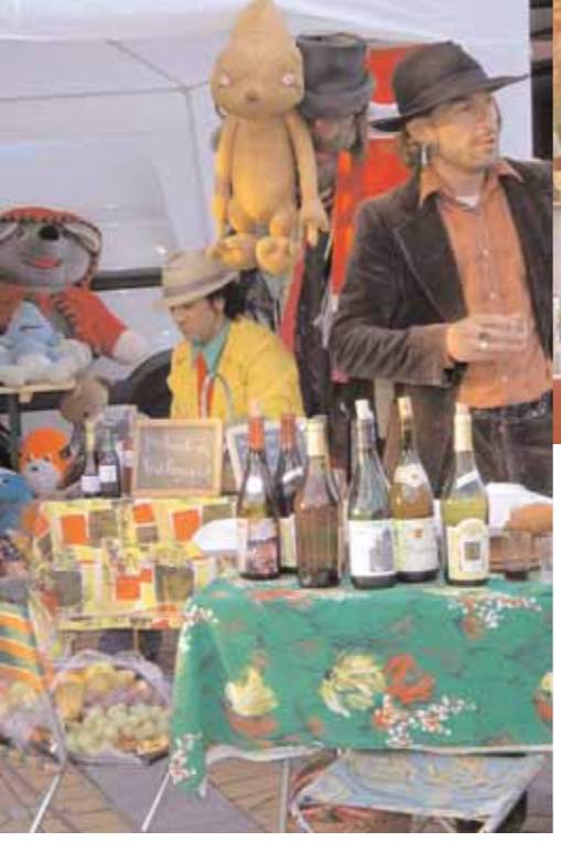
Stand 2000