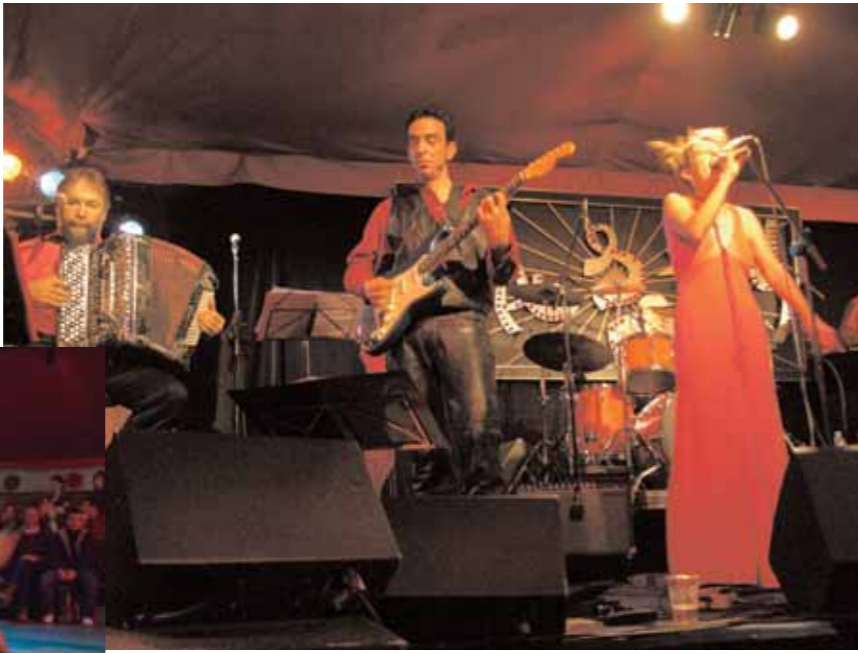
^ Le Grand Bal < Le Grand Bal