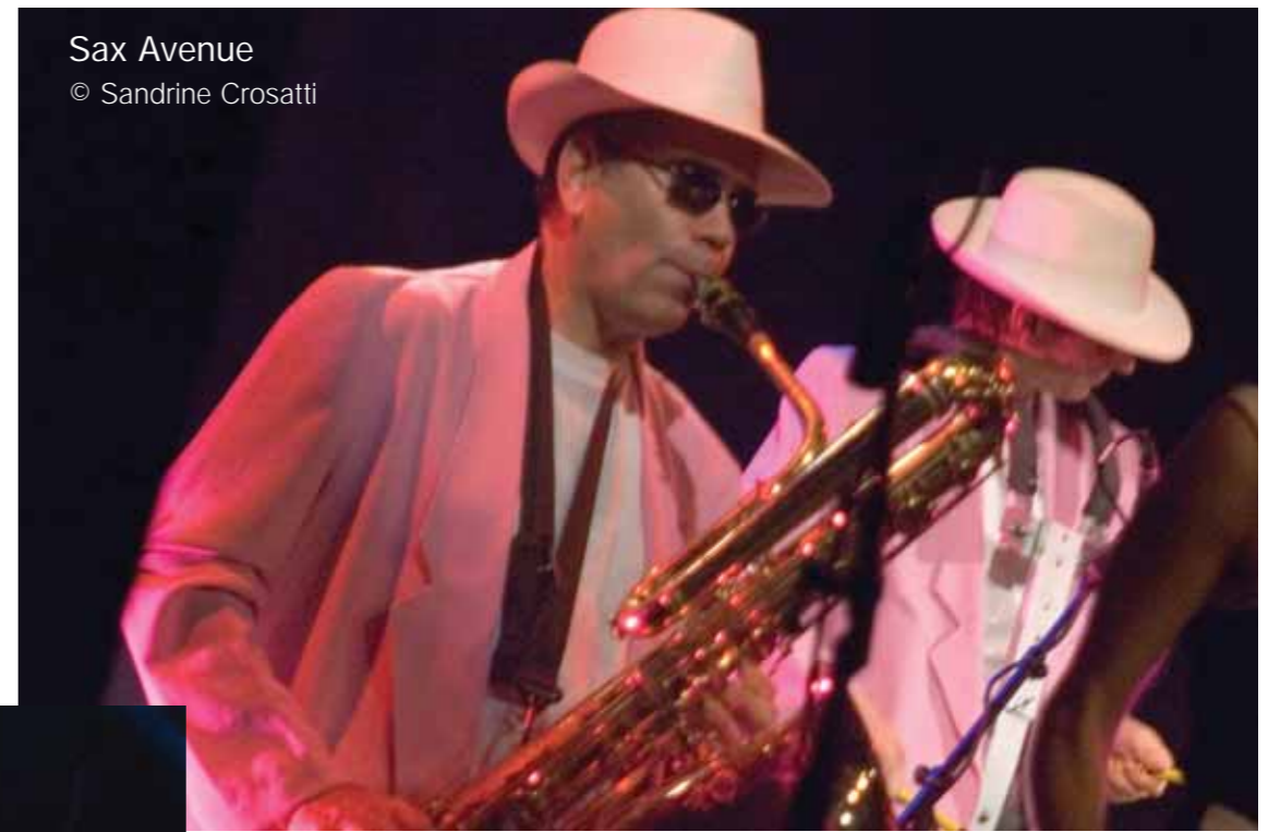
Sax Avenue