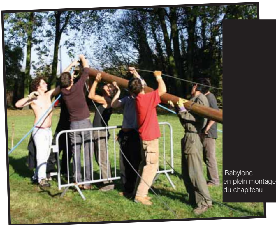
Babylone en plein montage du chapiteau

L'idée des «Vieux démons», donc, c'était de faire un pied de nez aux idées reçues sur le théâtre, de faire table rase des résidus qui nous canalisent tous dans une conception unique du travail des comédiens, et de reconstruire un peu de liberté dans tout ça. Voire même de retrouver le côté «naturel» du jeu théâtral.