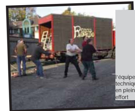
l'équipe technique en plein effort

M. Galloor : Habituellement sept personnes, mais aujourd'hui trois, ce sont tous des ALE.