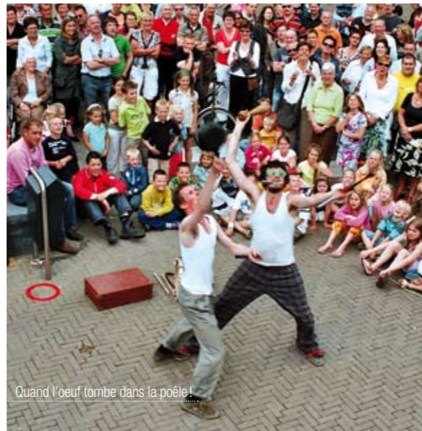
Quand l'œuf tombe dans la poêle!