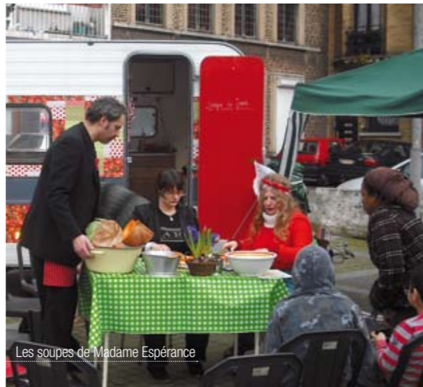
Les soupes de Madame Espérance

Une organisation Sambraisite et PBA+Eden.