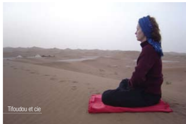
Tifoudou et cie