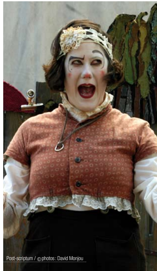
Post-scriptum / ©photos : David Monjou