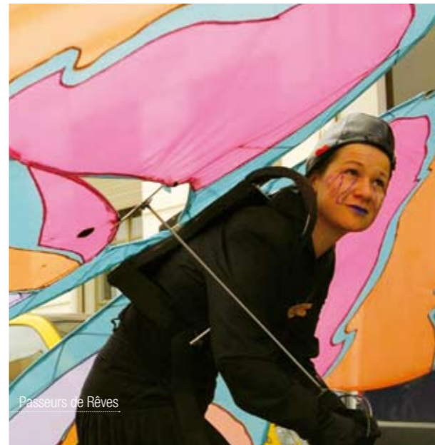
Passeurs de Rêves