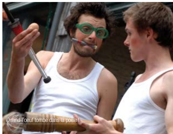
Quand l'œuf tombe dans la poêle!